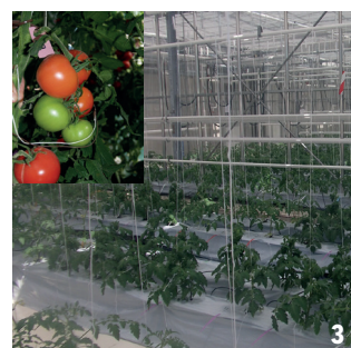
(1) Étude de pratiques culturales en verger de pêcher. (2) Étude du contrôle des ravageurs par les auxiliaires : une forficule s'alimentant dans une colonie de pucerons. (3) Étude des effets du climat et de la ferti-irrigation sur la production de tomates sous serre.